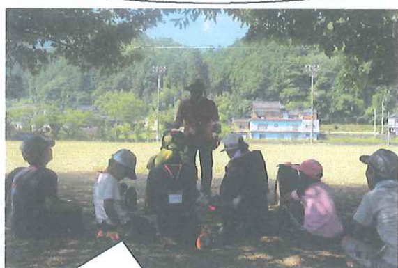
ネイチャーゲームで自然を感じ、自然の声をききました！