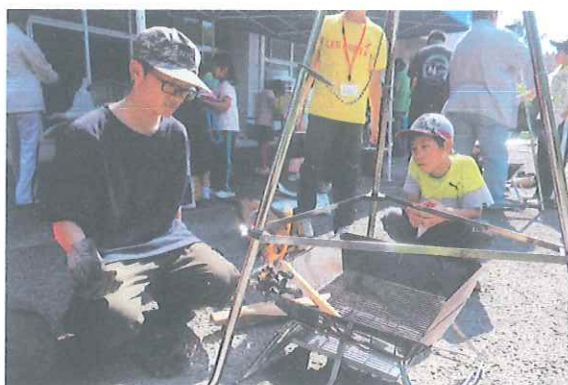
火をつけるコツを教えてくださいます！