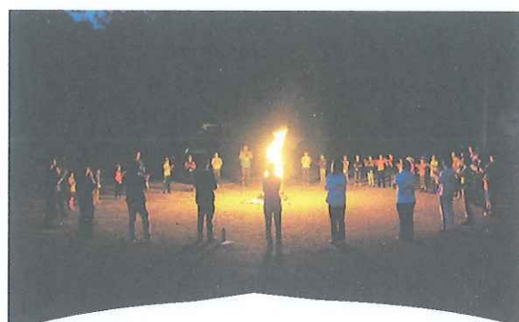
待ちに待ったキャンプファイヤーでのお楽しみスタンプ！！