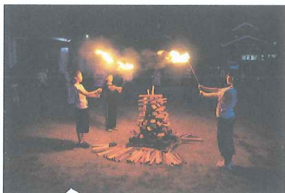
神聖な火を囲み誓います。