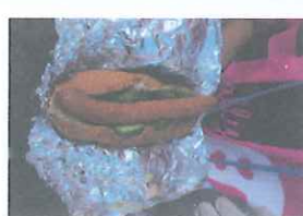
牛乳パックで、ホットドッグをつくりました！