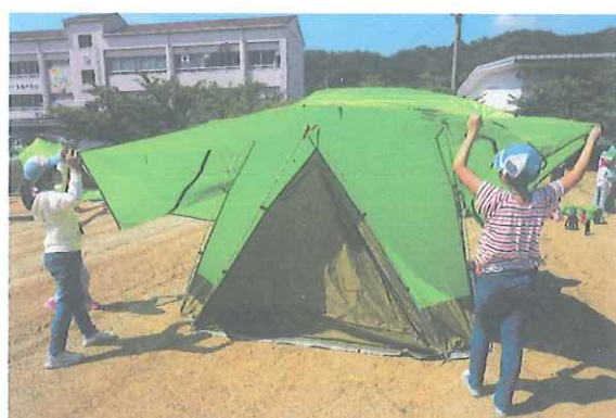
みんなで協力してテント設営！